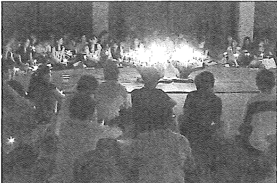
キヤンドラライトサービス