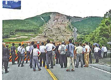
阿蘇大橋 地滑りを起こした正面の山

2017年8月21日(月)〜22日(火)、熊本市の九州ルーテル学院を会場とする第2回全国災害支援連絡会議を実施し、講師・事務局を併せて60名が参加しました。 第1日目 アトラクション「バスを被災地を巡る」 寸断した主要道の迂回道路をバスで巡るのり、見ました。今も県内で約4万5千人が仮設住宅で生活し、仮設住宅で225名が亡くなったという悲惨な現実を肌で感じました。阿蘇の山々は地滑りで