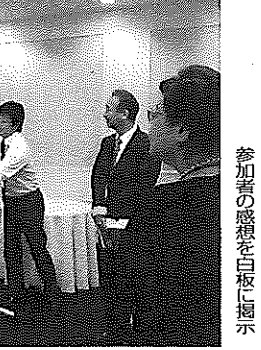
参加者の感想を白板に掲示