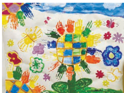
学生との交流のため地域の小学生が描いたウクライナ国花(ひまわり)