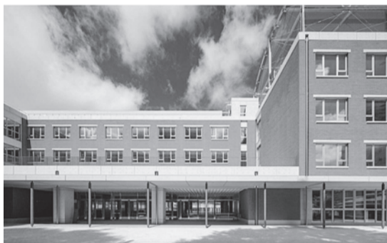
フロントヤード~エントランス