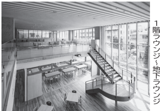
1階ラウンジ&地下ラウンジ