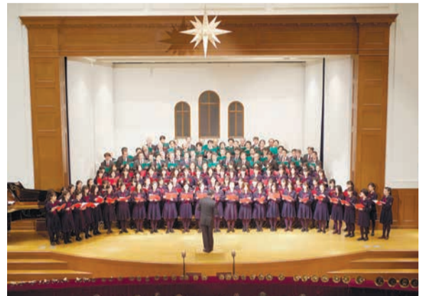
今年はコロナ禍のため、父親合唱部の参加はなし

音楽会を外部にも開き、多くの受験生親子と共に、音楽でクリスマスに祝うことができるように、本校には教育活動に賛同し、野外施設の整備や文化祭での警備などに積極的に協力してくれた「父親有志の会」がある。この中には様々な同好会があるが、その一つが合唱部だ。1999年に父親合唱部が参加して以来、本校は女子校であるにもかかわらず、毎年クリスマス音楽会で、華やかで力強い混声合唱の演奏が可能になった。娘たちと同じ舞台上立つ父親たちの喜びとは裏腹に、娘たちは少し照れ臭いようではあるが、この