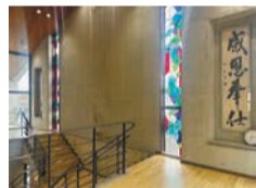
光あふれる踊り場